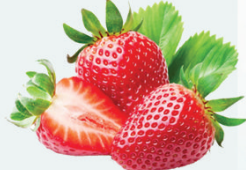
စတော်ဘယ်ရီ

Scutellaria ပန်းနှင့်အပင်၊ လိမ္မော်သီးနှင့်စတော်ဘယ်ရီအစရှိသော အပင်(၃)မျိုးမှရရှိသော Flavonoid ဓာတ်ဖြစ်ပါသည်။