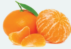
လိမ္မော်သီး