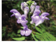
Scutellaria ပန်းနှင့်အပင်