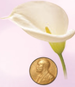
2011 The Nobel Prize in Physiology or Medicine