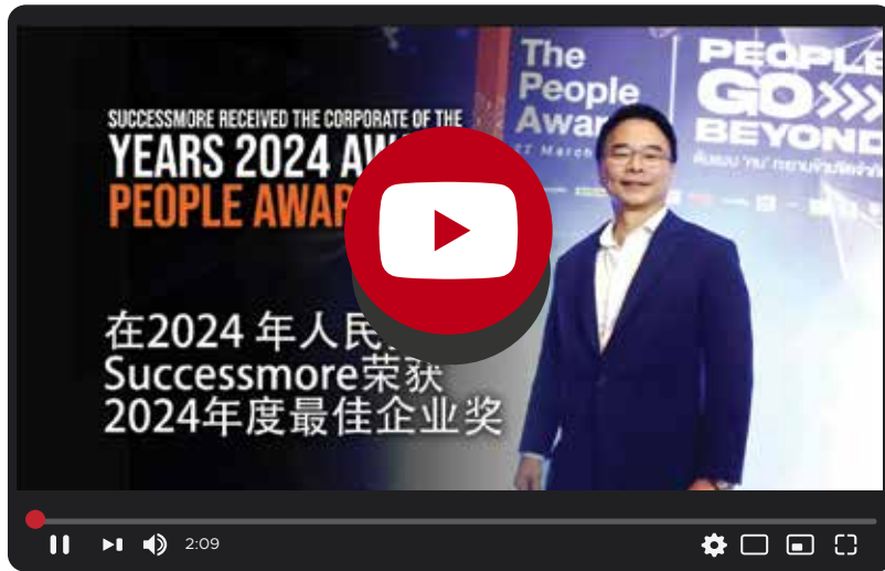
Successmore received The Corporate of the Year 2024 Award at The People Awards 2024