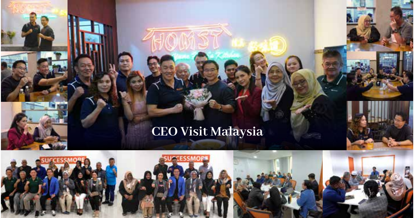
CEO Visit Malaysia