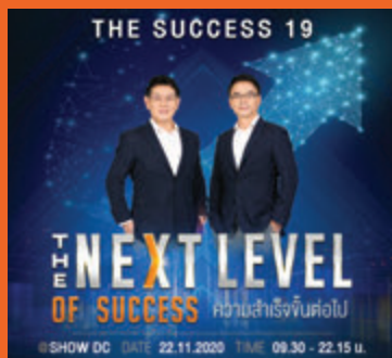
การพัฒนาขีดความสามารถ ของระบบ SLA ให้สอดคล้องกับ ยุคสมัย จนระบบงานสามารถ ทำนายผลลัพธ์ของความสำเร็จได้

ดังนั้น หากมีใครถามว่า “ทำไมต้องมี ซัคเซสมอร์ หรือ SCM อยู่ในโลกใบนี้” คำตอบก็คงต้องเป็นเราอยู่ในโลกใบนี้เพื่อ เป็นพลังแห่งชัยชนะของชีวิตมนุษย์ ทั้งใน ด้านสุขภาพ คุณภาพชีวิต พลังงานในการ เอาชนะอุปสรรคปัญหาที่เกิดขึ้นในทุก ๆ บทบาทของผู้คน และเราอยู่เพื่อให้ ผู้คนมีโอกาสบรรลุศักยภาพของตน การมี ความหวัง มีโอกาสและการสร้างความเป็น ไปได้ใหม่ ๆ ให้แก่ชีวิต>>>